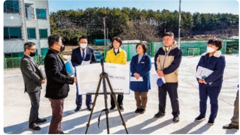
2023. 2. 23. 현장방문 활동 - 북구장애인보호작업장