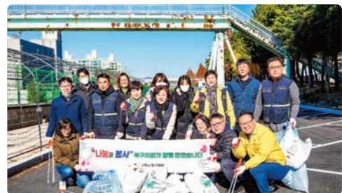
동해남부선 폐선부지 보행로 정화 (2023. 11. 30.)