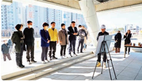
2023. 2. 23. 현장방문 활동 - 송정북합문화센터