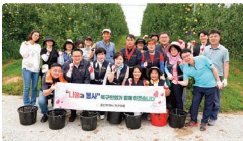
사과농장 일손 돕기 (2023. 9. 12.)