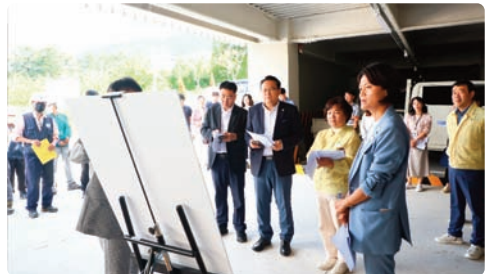
2023. 9. 8. 현장방문 활동 - 이화정마을 도시재생사업 현장