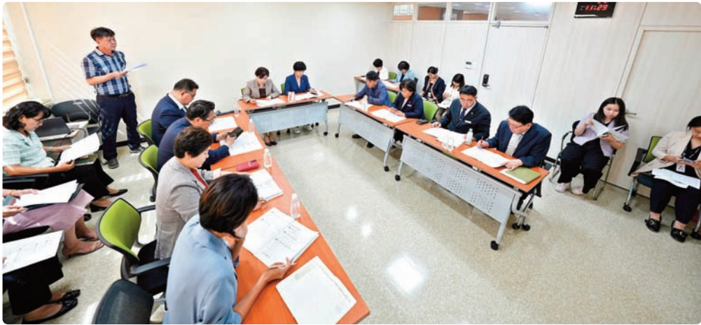
의원간담회(월 1회 정기 및 사안별 수시 회의)