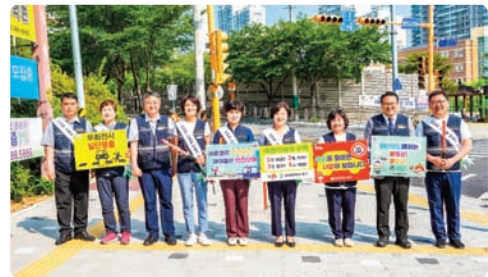
초등학교 등굣길 안전 도우미 (2023. 6. 9.)