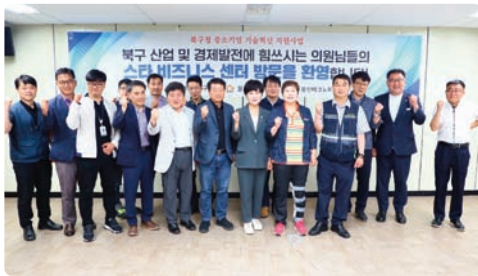
2023. 6. 22. 현장방문 활동 - 스타비즈니스센터