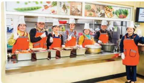
'어르신행복식당' 배식 봉사활동 (2023. 3. 22.)