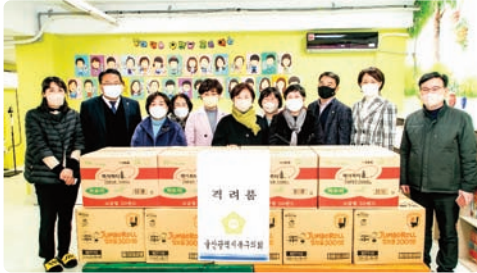
설·추석맞이 시설방문 및 격려품 전달