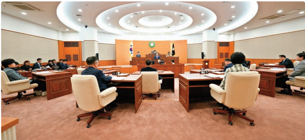
예산안, 조례안 등 심의 및 의결 (제210회 임시회 ~ 215회 정례회)