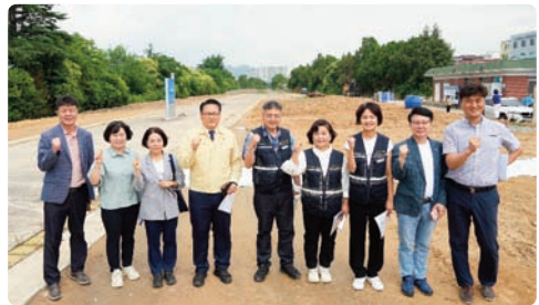
2023. 6. 22. 현장방문 활동 - 동해남부선 폐선부지 숲 조성 현장