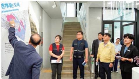
2023. 9. 8. 현장방문 활동 - 소금포역사관