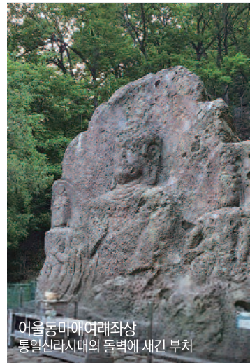
어울동마애여래좌상 통일신라시대의 돌벽에 새긴 부처