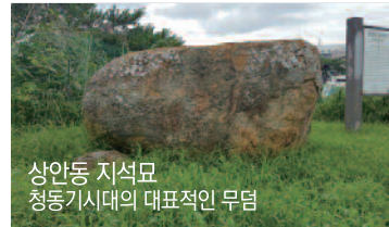
상안동 지석묘 청동기시대의 대표적인 무덤