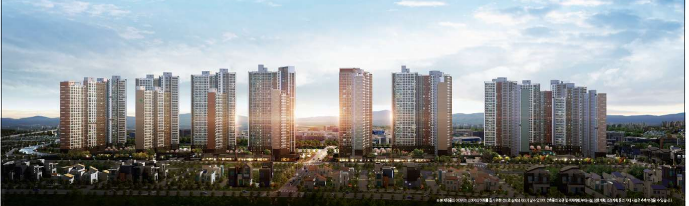
*본 매지일은 2022년 3월 31일 현재를 기준으로 실거래가 차이가 발생할 수 있으며, 인근 물리환경 및 배후시설, 역사, 교통, 생활 편의 시설 등 주변 환경은 수시로 변경될 수 있습니다.