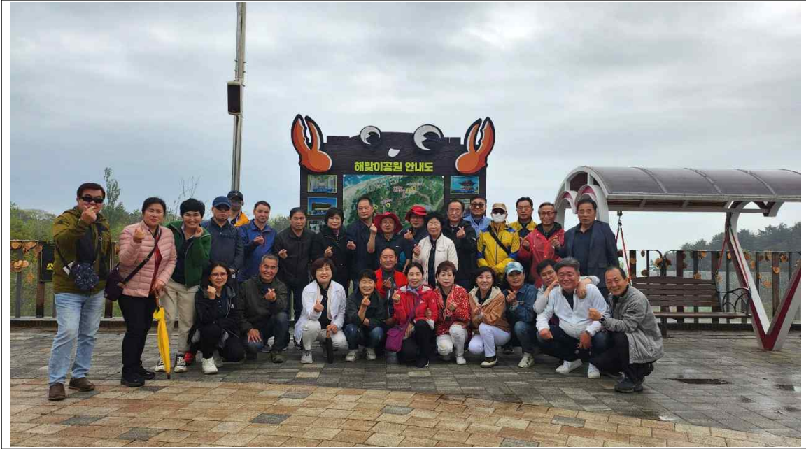
4. 18. 선진지견학 워크숍(울진 망양정 해맞이공원)