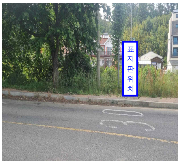
○ 금천마을회관 정류소 방면