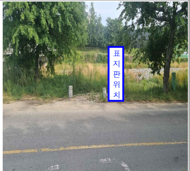
○ 구암마을 정류소 방면