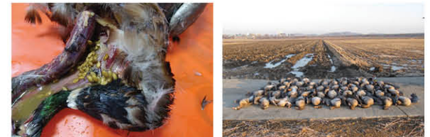
(폐사체 부검 시 식도에서 검출된 벌씨) (기러기 및 오리류(청둥오리) 집단폐사)