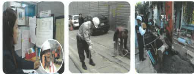
굴착신고 사전협의 담당자 입회 후 굴착

굴착공사정보지원센터(EOCS) 1644-0001 www.eocs.or.kr