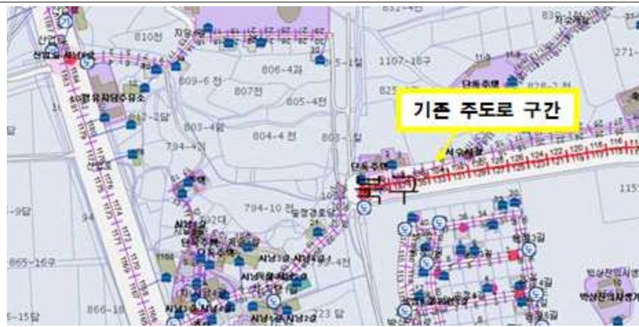
도로명주소 기본도 (변경 전)