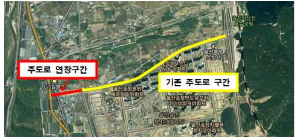
도로명주소 기본도 (변경 후)