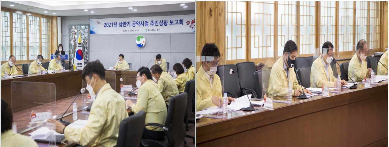
회 의 사 진