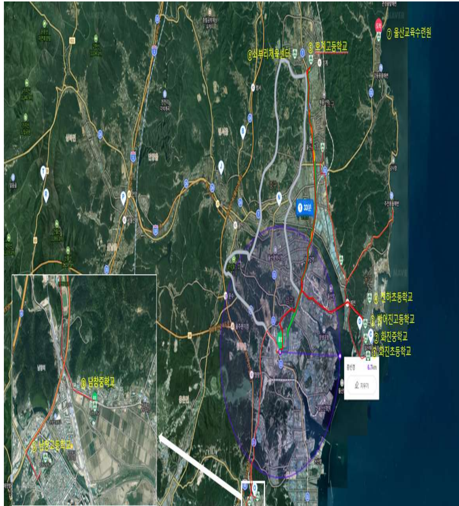
<그림 14. 주민대피장소 위치도>