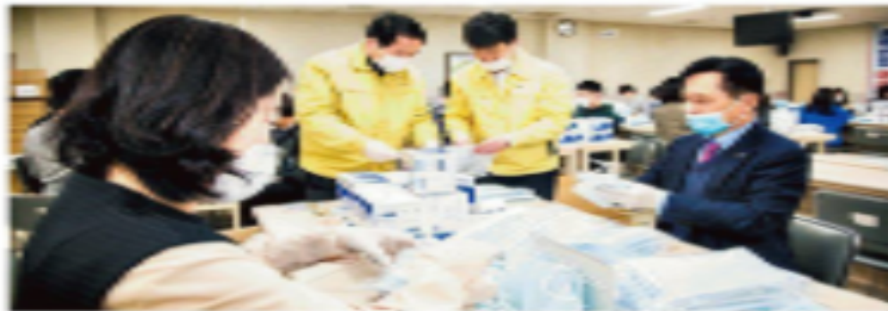
북구, 주민 배부용 마스크 소분작업

○ 동관 북구청장과 직원들이 17일 구청 민방위 교육장에서 울산내로부터 받은 민방위마스크를 주민들에게 배부하기 전 시연 소분작업을 하고 있다.