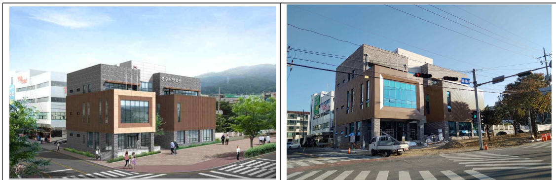
북구 노인회관 조감도 및 공사사진