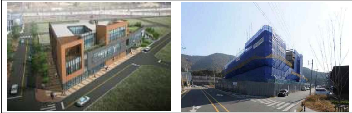
공공산후조리원 조감도 및 공사사진