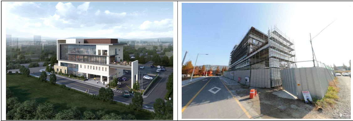
평생학습관 조감도 및 공사사진