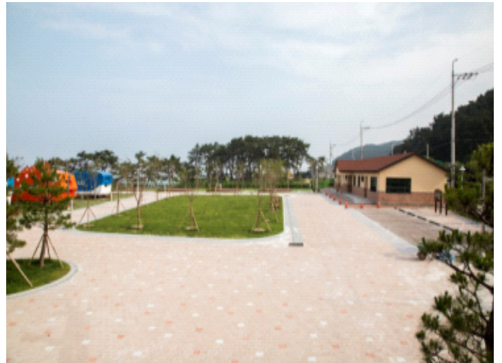
캠핑장 전경(잔디광장, 관리동)