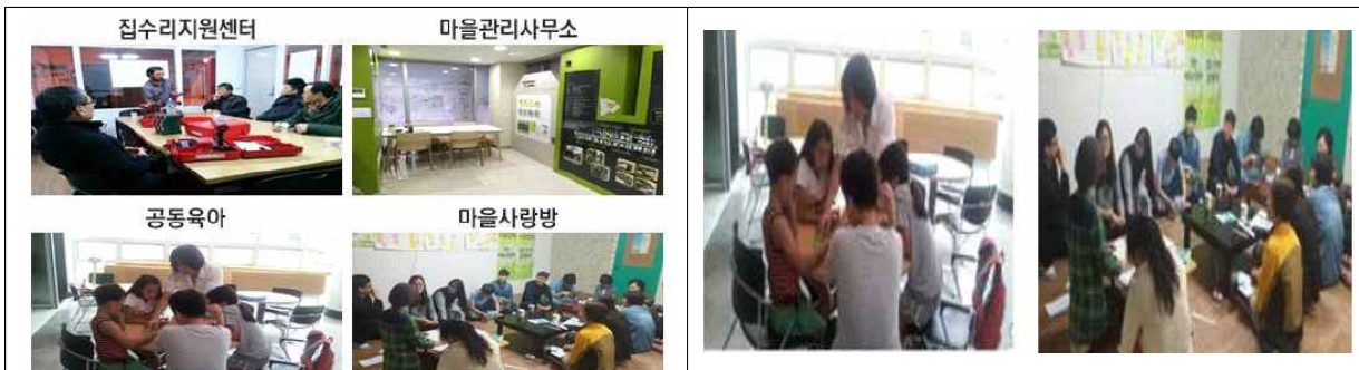
주민주도 도시재생 지속 거점