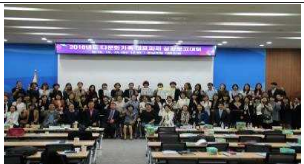
<충청남도 최우수사업 선정>