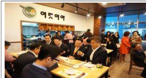
이맛이야(I'm Asia) 내부전경