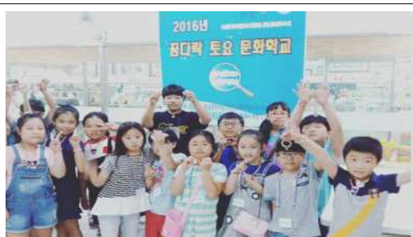
꿈다락 도요 문화학교 운영 모습