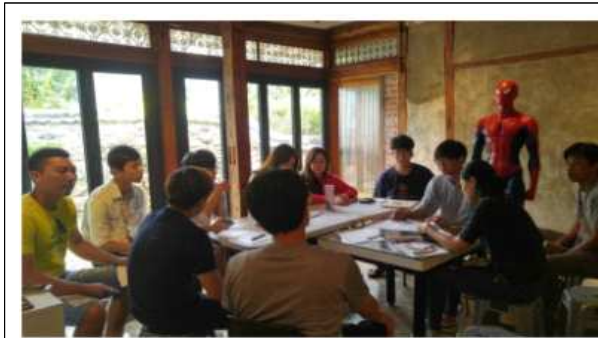
기억의집 1920 한옥 레지던스