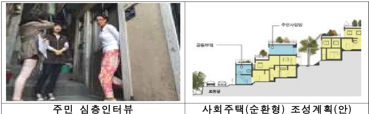
< 부산중구 햇살등지사업 >