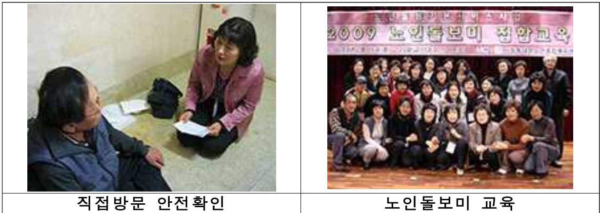
< 서울시 노인돌봄서비스 >