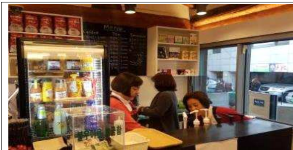
백남준 카페 운영