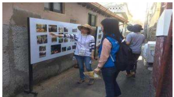
골목길 투어 중