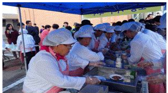
묵 시식 행사