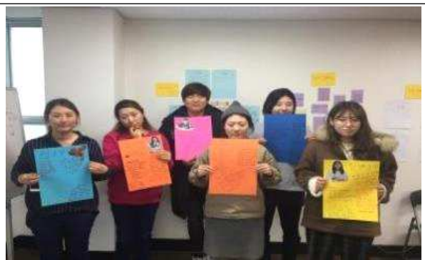
뉴딜일자리 활동가 교육