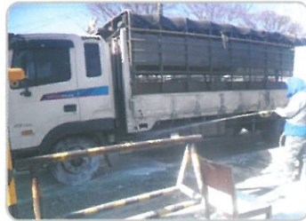
차량 바퀴 소독