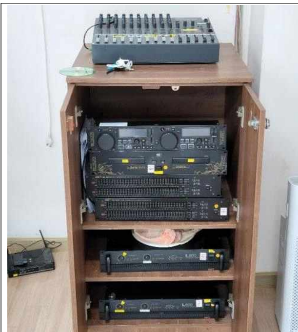
▲ (기준) 명촌문화센터 2층 다목적실 음향장비