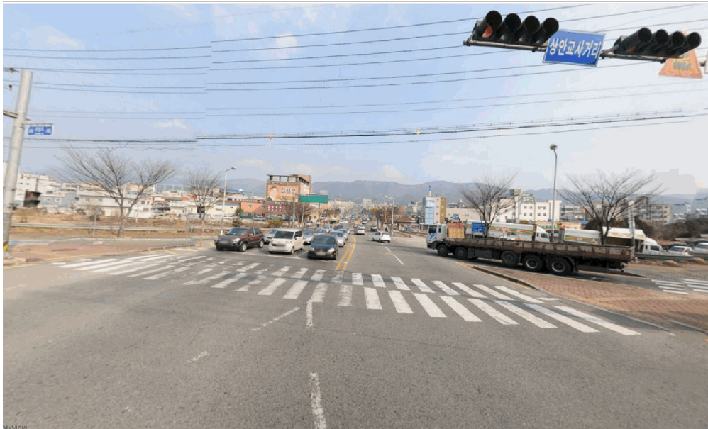
위치도[빨강: 통행제한(금지)도로, 파랑: 우회로]