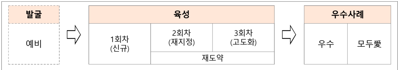
< 마을기업 성장단계에 따른 구분 >